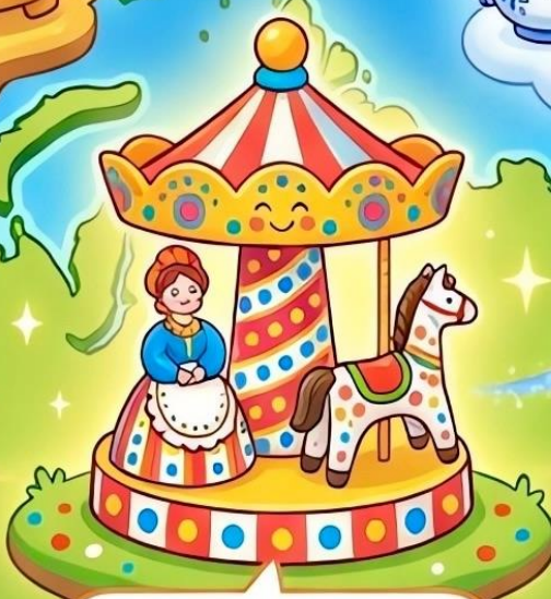
Дымковская игрушка (веселье, ярмарка)