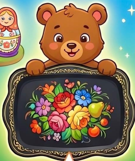
Жостовская роспись (цветы, поднос)