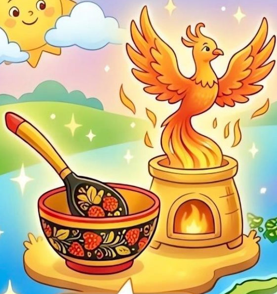
Золотая Хохлома (огонь, ягоды)