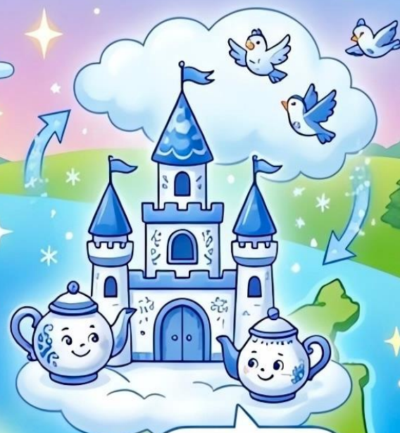
Синяя Гжель (зима, узоры)