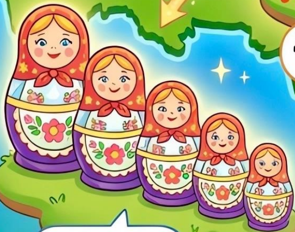
Матрёшка (семья, секрет)