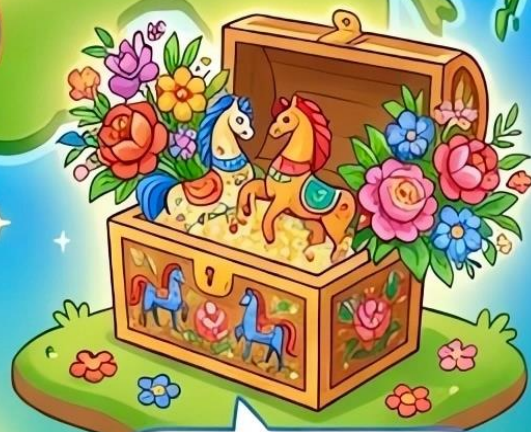
Городецкая роспись (праздник, кони)