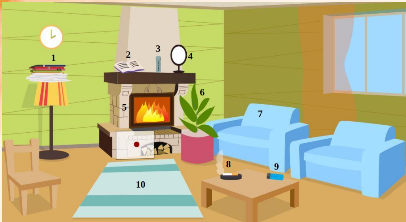
Рис. 4 Проверь найденные нарушения пожарной безопасности в гостиной