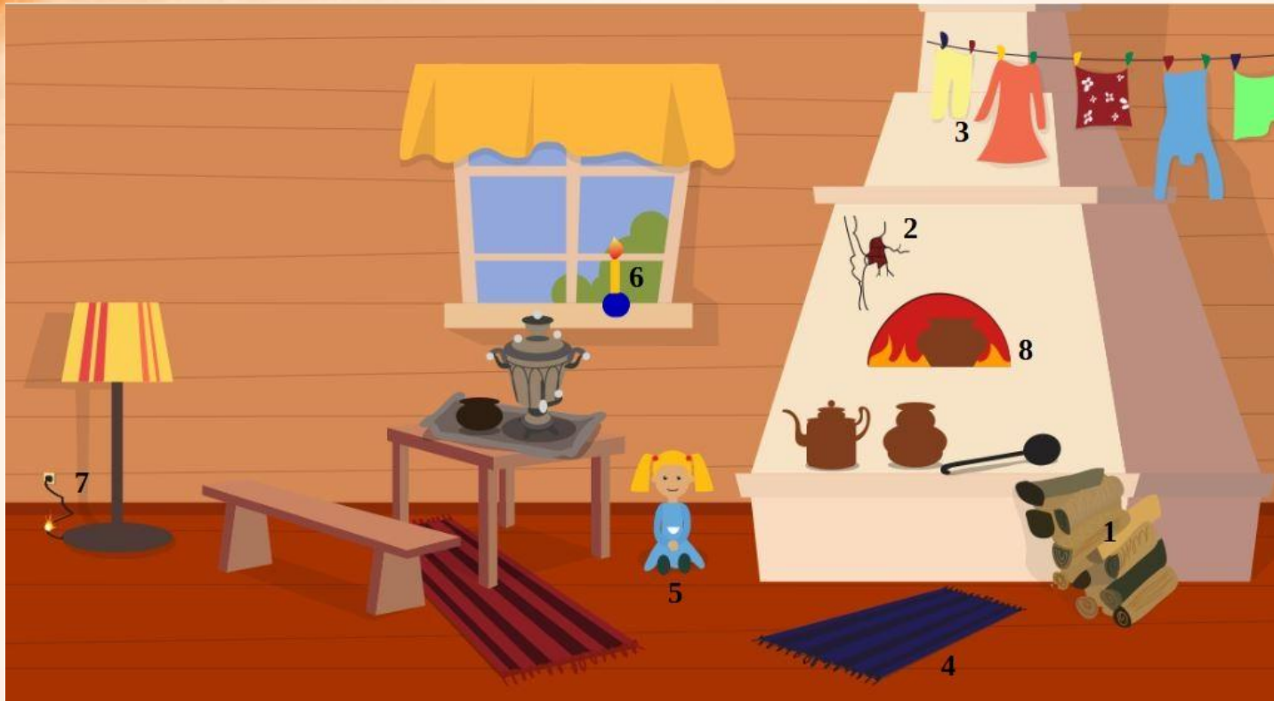
Рис. 1 Проверь найденные нарушения пожарной безопасности в доме