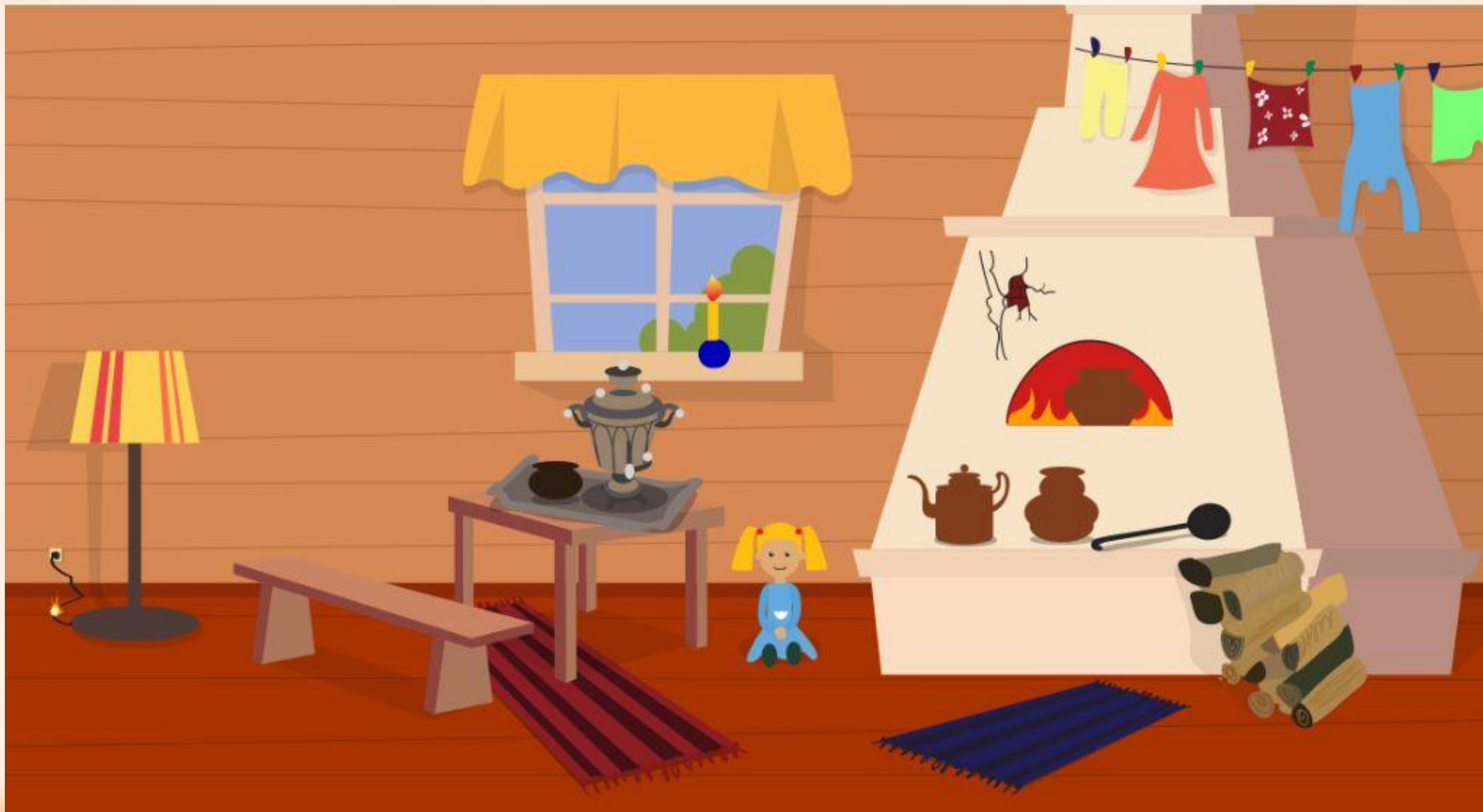
Рис. 1 Найди нарушения пожарной безопасности в доме (8 нарушений)