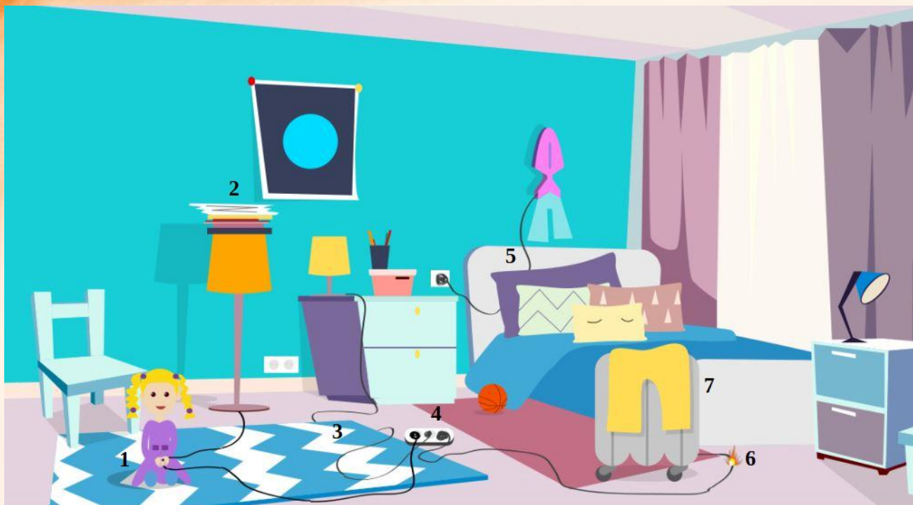
Рис. 5 Проверь найденные нарушения пожарной безопасности в детской