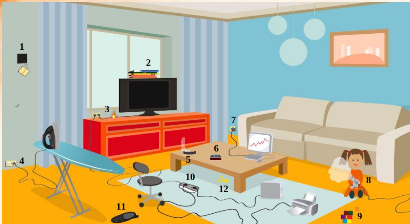
Рис. 3 Проверь найденные нарушения пожарной безопасности в гостиной